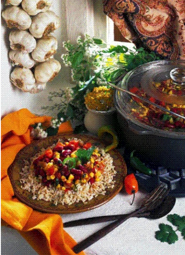
Рис моют, подсушивают, кладут в кастрюлю, добавляют изюм и 2 столовые ложки растительного масла. Ставят на огонь и тушат до тех пор, пока рис не зарумянится. Лук и чеснок мелко рубят и обжаривают на растительном масле, затем к ним добавляют мясо и мелко нарезанный перец и тушат все в течение 10 мин.

Вода – 500 мл, помидоры – 250 г, мясо рубленое – 250 г, рис – 250 г, изюм – 80 г, лук репчатый – 80 г, шпик – 80 г, масло растительное – 60 мл, перец красный острый – 1 шт. (или перец красный молотый – 20 г), чеснок – 1 зубчик, соль.