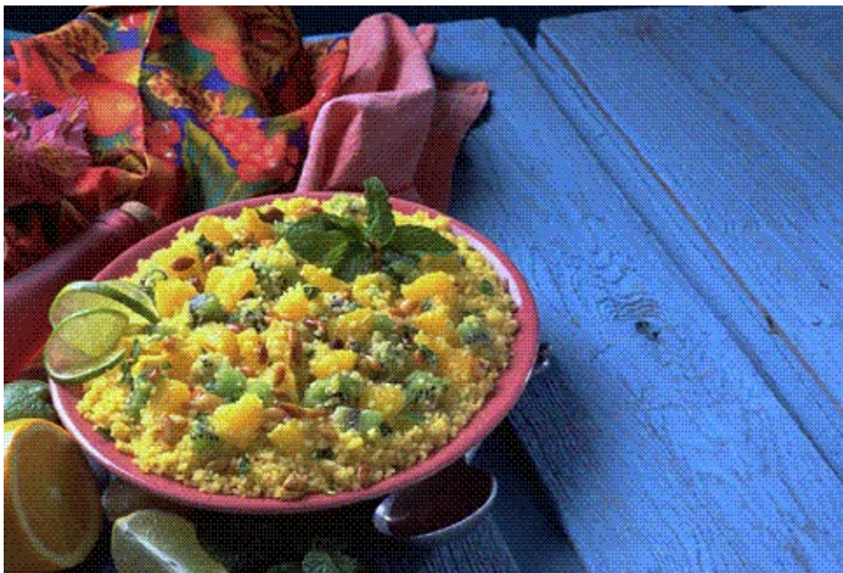
Рис промывают и варят в подсоленной воде до полуготовности. Лук мелко нарезают и пассеруют в растительном масле до золотистого цвета. Затем добавляют нарезанный соломкой острый перец, соль, рис, доливают воду, так чтобы она слегка покрывала продукты, и варят 25 мин. После этого добавляют кукурузу и фасоль, перемешивают плов и варят еще 5-10 мин.

Готовый плов выкладывают горкой на блюдо и подают к столу.