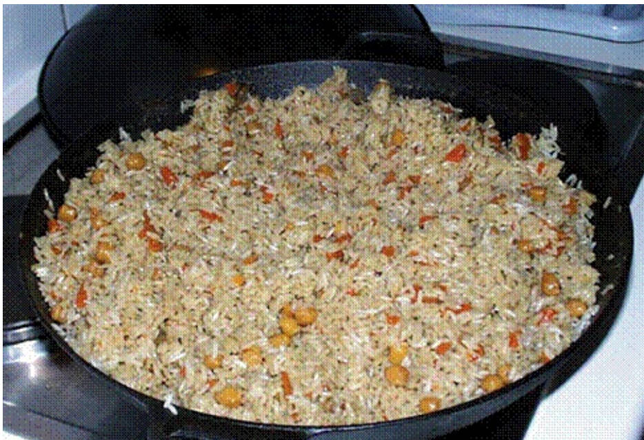
Рис промывают, заливают холодной водой и оставляют на 1 ч. Лук мелко нарезают и жарят в растительном масле до золотистого цвета. Затем добавляют тмин, соль, перец, рис, доливают воду, так чтобы она слегка покрывала продукты, и варят 20 мин. После этого добавляют кукурузу, перемешивают плов и варят до готовности.

Готовый плов выкладывают горкой на блюдо и подают к столу.